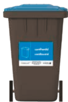
Bin du gyda sticer glas