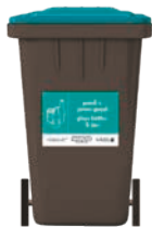
Bin du gyda sticer gwyrdilas